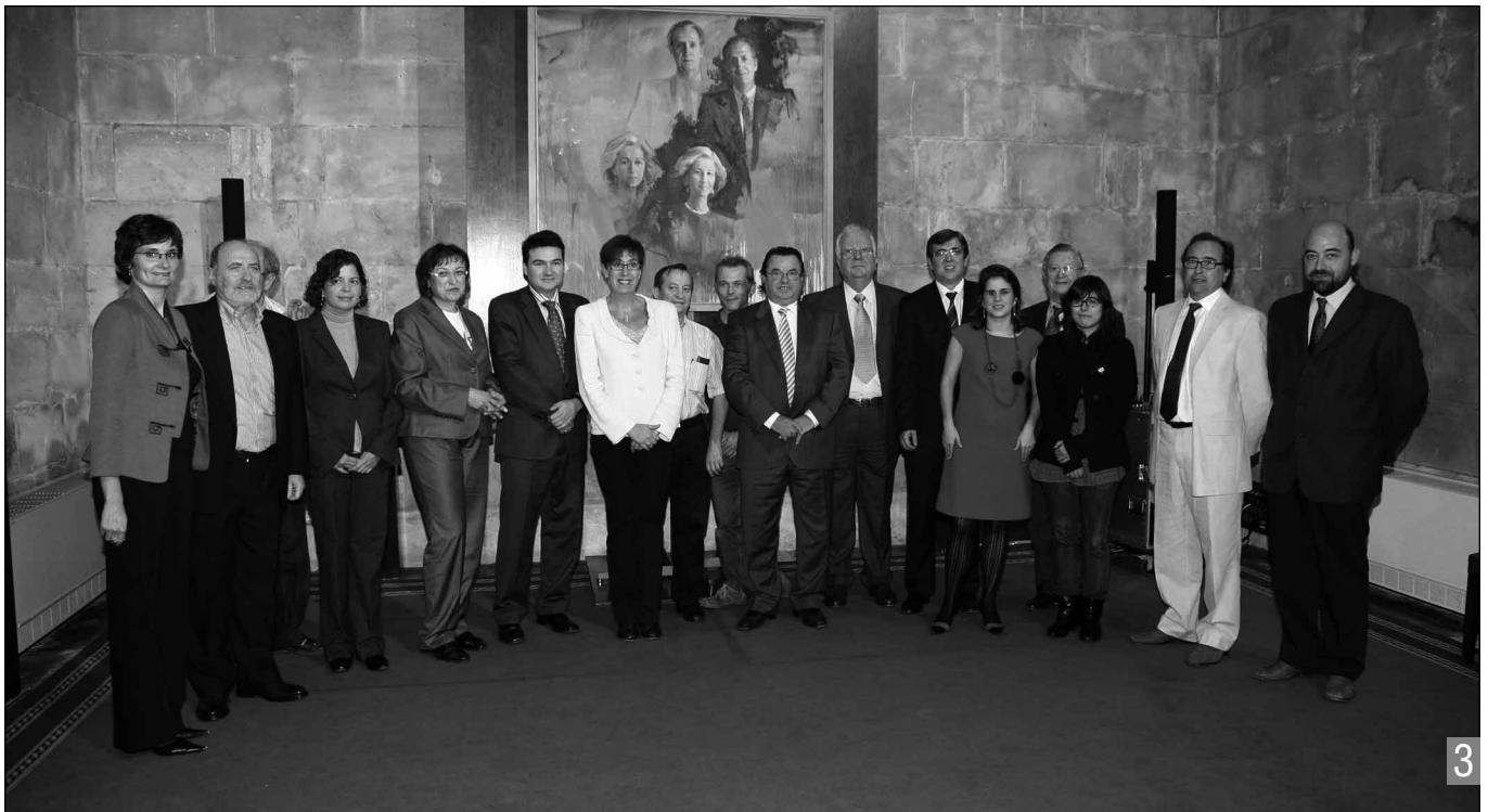
Els integrants del comitè assessor del Congrés de RSE de les PIMEs amb Francesc Antich i Joana Barceló.

L'any que estam a punt d'esgotar haurà esdevingut l'cabdal en l'impuls de la Responsabilitat Social Empresarial a la comunitat. Iniciatives com la creació d'una direcció general de RSE en el si de la Conselleria de Treball, juntament amb l'existència d'una xarxa associativa empresarial que anava desenvolupant un treball constant de conscienciació, han permès que la concepció de la necessitat d'una gestió empresarial responsable en el pla ambiental i social es faci un lloc en el si de la societat.