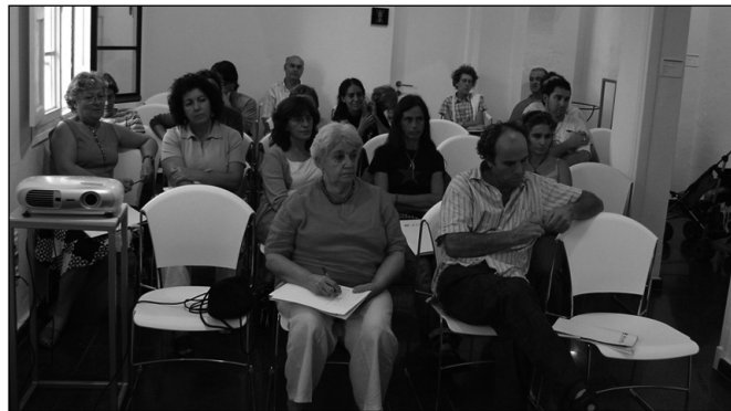
Membres d'Entremans en un acte de l'associació.

Les dues associacions, lligades orgànicament a AELIB i APTA, aprofitaren les assemblees per a adaptar els seus estatuts a la Llei de l'Estatut del Treball Autònom.