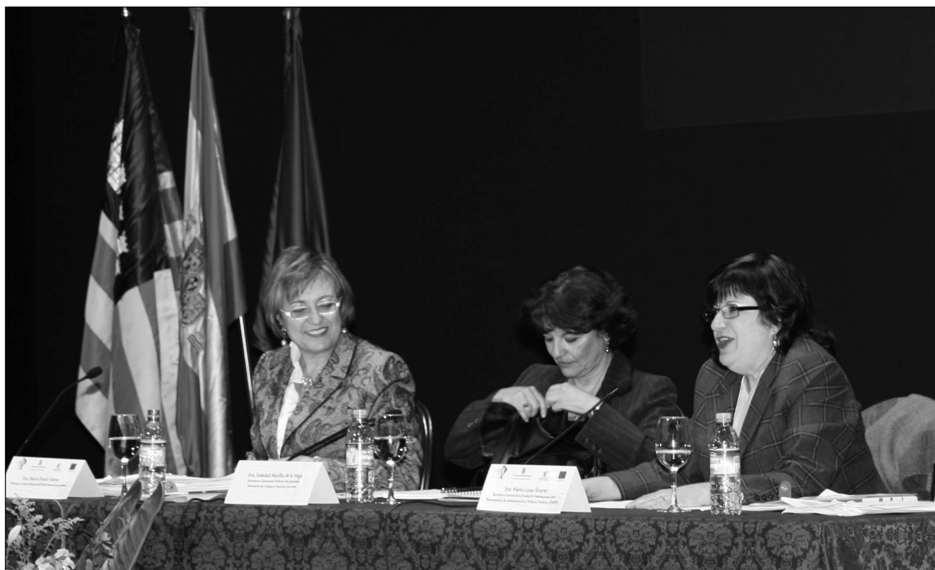
Al congrés s'abordaren les polítiques d'igualtat i conciliació.

Els passats 24 i 25 d'octubre va tenir lloc a Palma el primer congrés celebrat a les Illes Balears sobre responsabilitat a les PIMEs. L'esdeveniment, impulsat per la Conselleria de Treball i Formació, va comptar amb el recolzament del Comitè Assessor, del qual va formar part un representant d'AELIB i APTA.