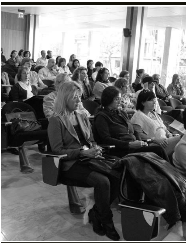
Públic I La convocatòria va tenir gran resposta.