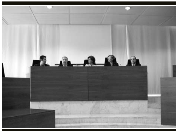
Acte I La sessió va tenir lloc el 24 de novembre.

Durant la jornada informativa celebrada el novembre, el director general d'Economia Social del Govern central presentà l'avantprojecte de llei per a la prestació d'ajuts per al cessament d'activitat dels autònoms.