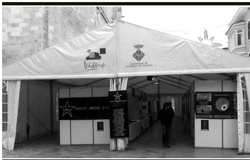
Ubicació | Aquest mercat es celebra a Ciutadella.