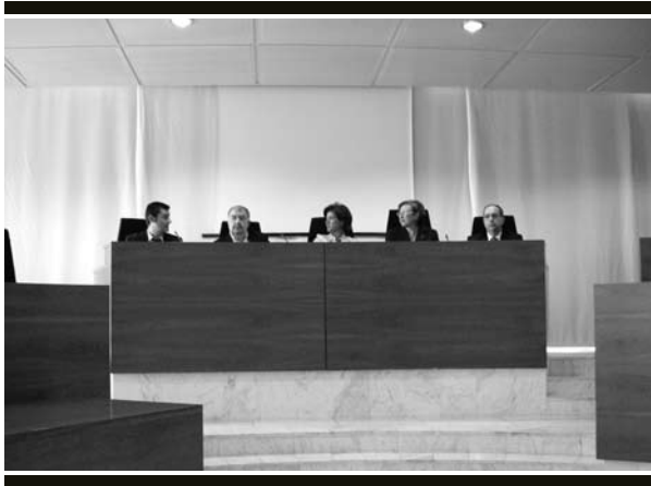
Acte I La sessió va tenir lloc el 24 de novembre.

Durant la jornada informativa celebrada el novembre, el director general d'Economia Social del Govern central presentà l'avantprojecte de llei per a la prestació d'ajuts per al cessament d'activitat dels autònoms.