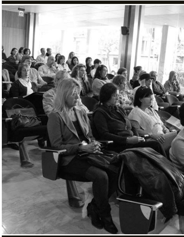
La convocatòria va tenir gran resposta.