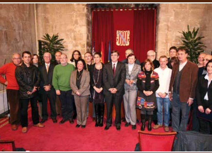
Constitució | Va tenir lloc al Consolat de Mar.