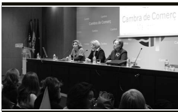
Públic | Xerrada a la Cambra de Comerç.