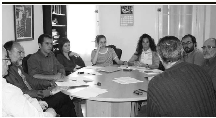
Fòrum | Es reuní el dia 20 de maig a Mercadal.

El passat dia 7 d'abril va tenir lloc a Mercadal la sessió fundacional de l'Associació per al foment de la responsabilitat social empresarial de Menorca constituïda, inicialment, per onze empreses i entitats. L'objectiu d'aquesta associació és aplicar i difondre la gestió socialment responsable basada en els valors de democràcia, transparència, justícia, ètica, la qualitat i la millora contínua. Una vegada constituïda l'associació, el passat 20 de maig va tenir lloc la reunió del Fòrum RSE de Menorca, en el qual hi participen AELIB i APTA, per posar en marxa el projecte de bones pràctiques per al sector de la restauració i hosteleria.